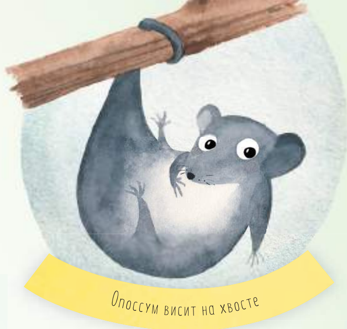
Опоссум висит на хвосте

Некоторые качества были приписаны животным по ошибке. Одно неверное мнение, и вот уже у нас другое впечатление о некоторых вещах. Ты говоришь, что страусы закапывают голову в песок, да? Совсе нет! Ты правда думаешь, что опоссумы днями напролёт висят на деревьях, ухватившись хвостом за ветки? Возможно, молодые опоссумы могут так повеселиться, но взрослые опоссумы просто используют хвосты, чтобы сохранять равновесие на коротких веточках. ►